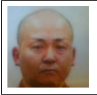
NEWAYS 育毛開始前 (本人確認用証明写真より)