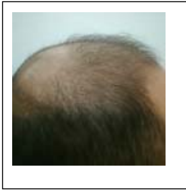
使用後 3 ヶ月